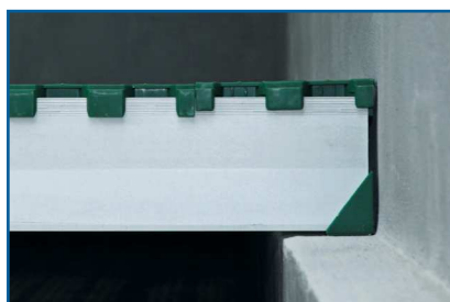
Poutre DUO avec protection DUO Protect