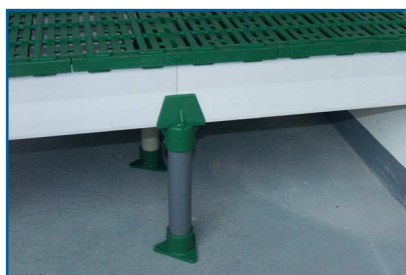
Support de poutre DUO