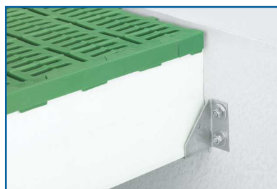
Support mural en acier inoxydable